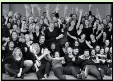
Théâtre - Poésie - Clown

Production maelstrÖm théâtre & Scènes en Nord